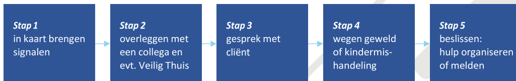
Figuur 1: Stappen Meldcode, oude situatie

In de aangepaste meldcode wijzigen de stappen 1, 2 en 3 niet. In de stappen 4 en 5 is het afwegingskader ingevoegd.